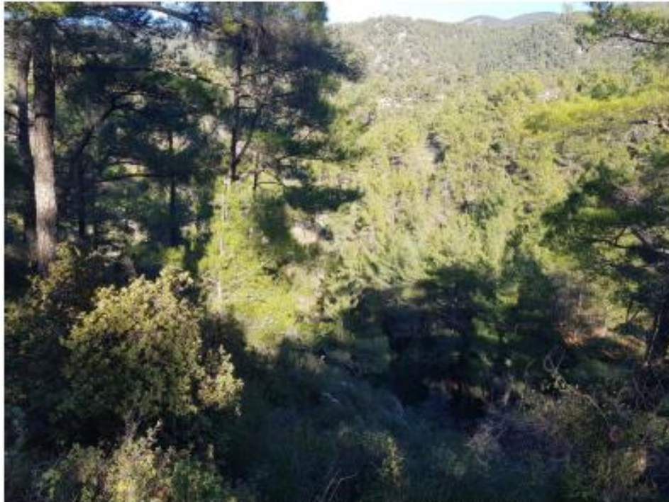
Η ευρύτερη περιοχή του εξεταζόμενου ακινήτου.