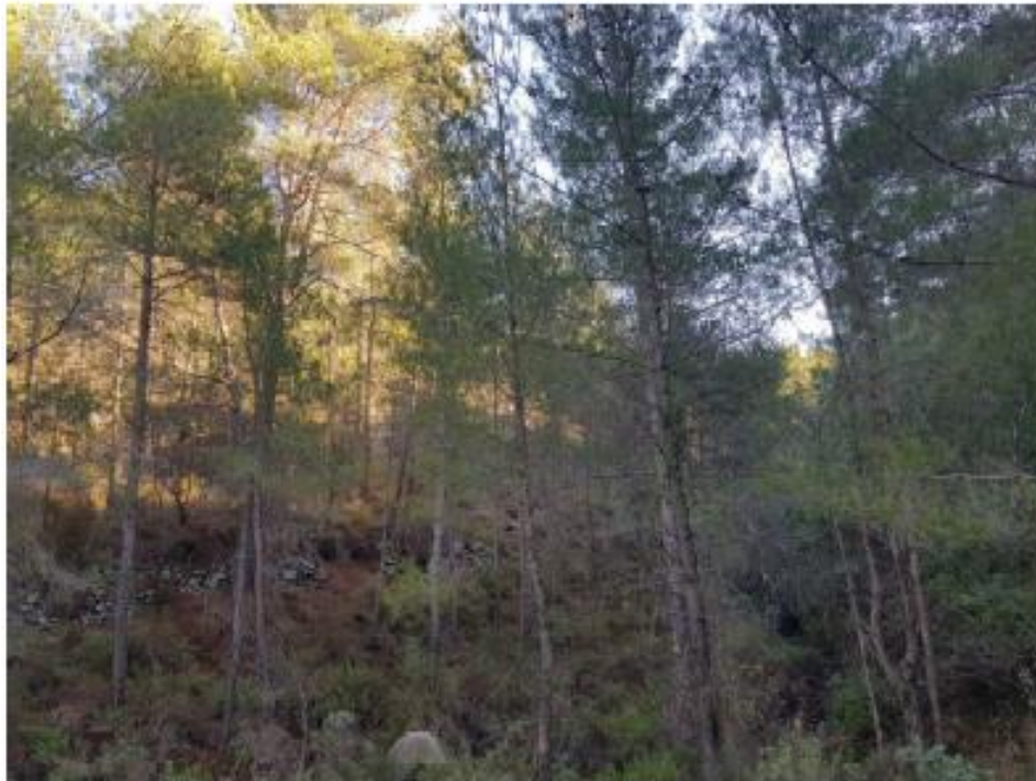
Μέρος του εξεταζόμενου ακινήτου.